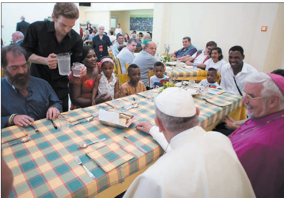
Campobasso (Itália). O Papa Francisco almoçou com os pobres apoiados pela Caritas.

Cada um de nós é necessário, é único e insubstituível.