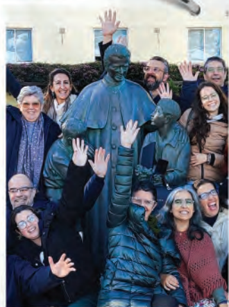
Encontro de Voluntários