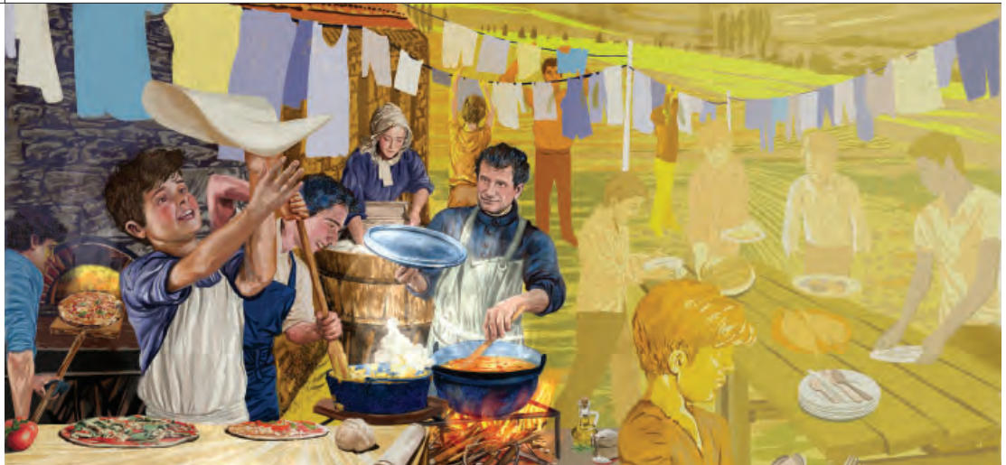
Ilustração de Nuno Quaresima para o Lema do Reitor-Mor de 2023

“A FAMÍLIA SALESIANA, EFETIVAMENTE INSERIDA NO ÂMAGO DAS MAIORES CARÊNCIAS DA HUMANIDADE DE HOJE, EM TODO O MUNDO, CONTINUA FORTEMENTE COMPROMETIDA EM PARTICIPAR NA CONSTRUÇÃO DE UM MUNDO MELHOR”