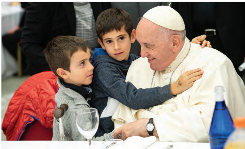
TEXTO BOLETIM SALESIANO

Um gesto simbólico, de partilha, de proximidade que se repete há vários anos. O Vaticano assinalou o Dia Mundial dos Pobres, no dia 13 de novembro, com várias ações: consultas médicas gratuitas, distribuição de cabazes alimentares, pagamento de faturas de energia e o almoço no Vaticano, organizado pelo novo Dicastério para o Serviço da Caridade. O Papa partilhou a mesa e conviveu com algumas crianças, famílias, imigrantes, sem-abrigo e utentes da Cáritas de Roma. Este ano foram 1.300 os convidados do Papa para o almoço. “Que Deus nos abençoe a todos neste encontro de amigos, neste almoço, às nossas famílias. Obrigado, bom almoço”, disse Francisco.