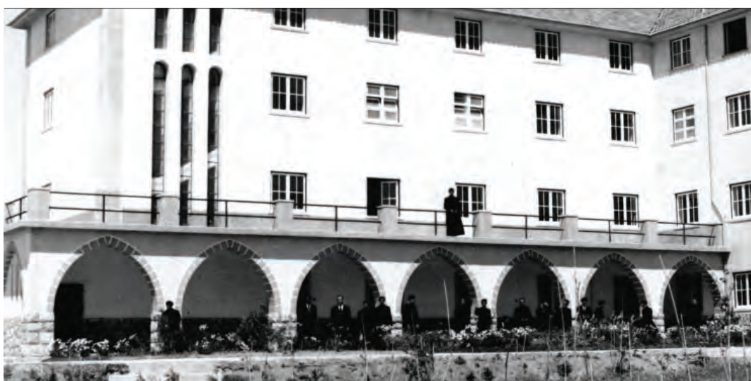
ARQUIVO BOLETIM SALESIANO

A fundação de uma casa salesiana exclusivamente dedicada à formação de novos salesianos para os estudantes do Curso Filosófico e Noviços, era um sonho antigo da Província Portuguesa da Sociedade Salesiana. A inauguração há 70 anos desta presença foi assinalada em vários momentos de festa que incluíram a inauguração pelo Reitor-Mor, Pe. Renato Ziggotti, em visita a Portugal.